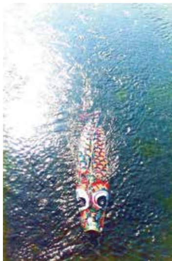
藤浩志「鴨川泳ぐこいのぼり」1983年