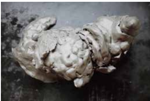
椿昇「FRESH GASOLINE マケット」1987年