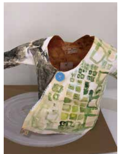
日比野克彦「HIBINO SPECIAL 2019」2019年